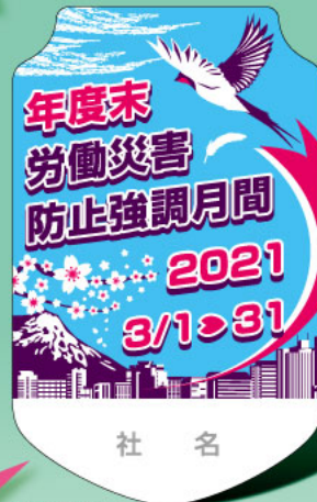
85×53mm PET製 2枚合わせ