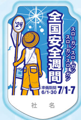
85x53mm PET製 2枚合わせ