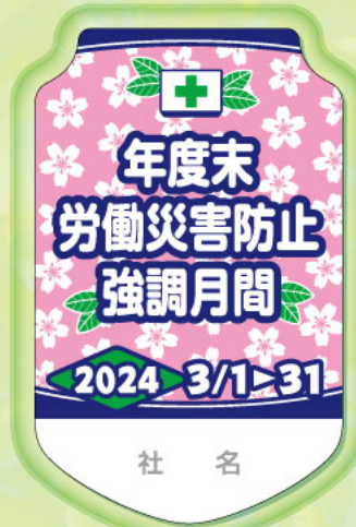
85×53mm PET製 2枚合わせ